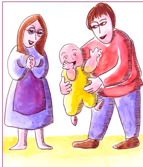
Illustration : Marie-Claude Cransac

Heureusement, en grandissant et avec l'amour de ses proches, il va changer de corps et changer de vie.