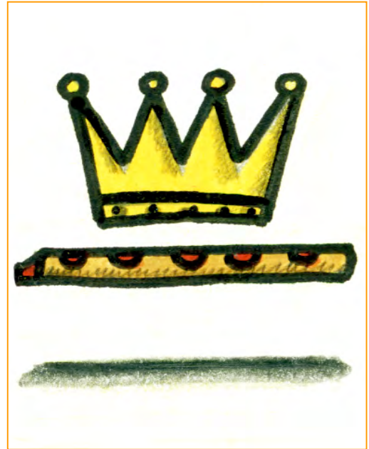
Illustration : Atelier Michel Bouvet

Ce parcours initiatique devient un voyage magique vers l'amour et la sagesse.